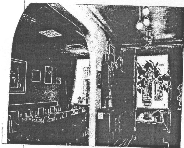
Музей письменника в Інституті філології Київського національного університету імені Тараса Шевченка.

Музейна кімната відтворена за зразками кабінету Олеся Терентійовича в будинку Роліт (аббревіатура назви «Робітник літератури») – спорудженого наприкінці 1920-х років багатоповерхового будинку кооперативу працівників літератури, що на вулиці Богдана Хмельницького, 68, де в Києві постійно проживав письменник з сім'єю.